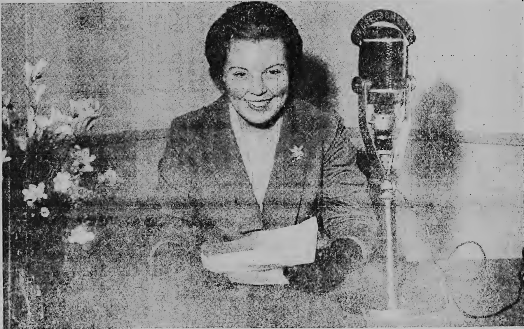
Prinses Beatrix durante di un momento pa lacion di e partinan di Reinado di Wiet na 1947 na cas den di Statendam 1947 y alavez en conexion coe e bishita coe e ta duna nos awor. E prinsesa ta di radio den su bida!